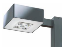
Mast- & Wandleuchte