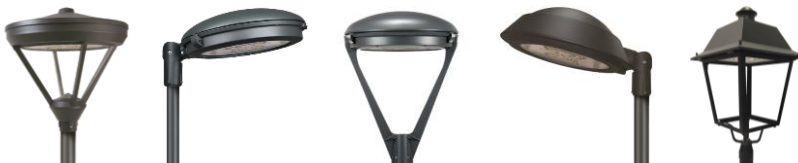
Serie URBAN dekorativ