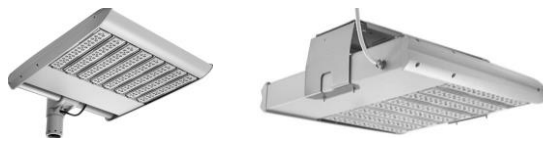
Type LW ROAD